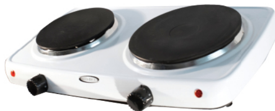
HP3B BULTO x6