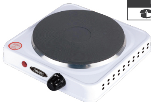
HP2B BULTO x12