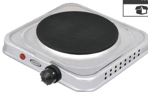
HP2B-A BULTO x12