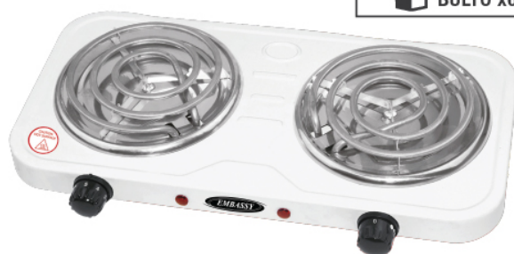
HP3B2000 BULTO x6