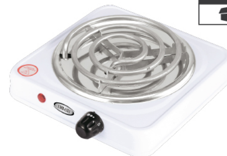
HP2B-B BULTO x12