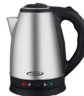
HE-EM1800 1,8 litros